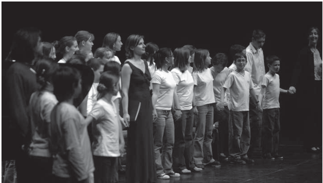
Chorale de la cité des arts - soirée d'ouverture 2006

Ce fut la bonne nouvelle de 2005 pour ce qui concerne la montagne et Chambéry : sa nomination de «Ville des Alpes 2006». Un événement qui met en exergue le travail accompli depuis des années pour la montagne et l'arc alpin en particulier.